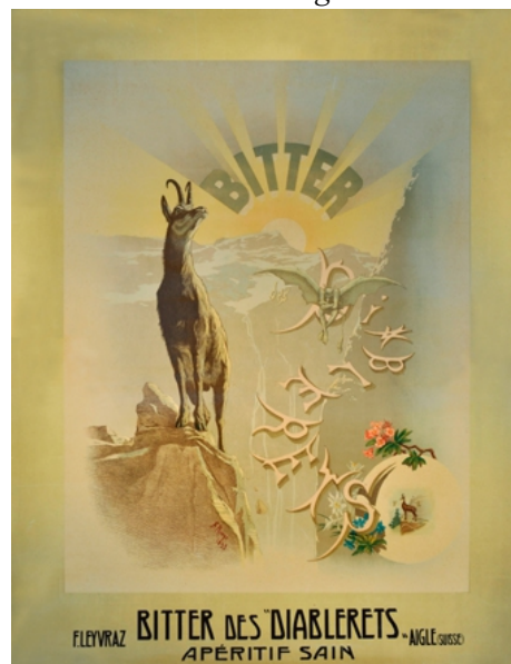
Première affiche, 1893