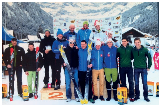
Les vainqueurs 2014