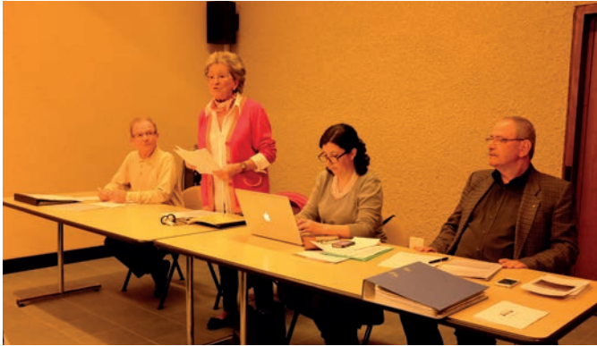
Table du comité

Finalement, les conversations, parfois soutenues et alimentées par toutes ces informations, ont pu être poursuivies pendant l'apéritif avant le dîner qui a suivi à l'Eurotel, où une majorité des membres présents à cette assemblée se sont retrouvés pour un excellent repas.